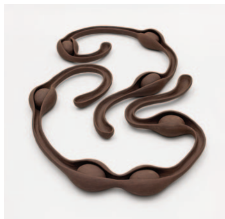
Jacque Faus, Sem título , 2026

Até 18 de julho / Almeida & Dale / Rua Fradique Coutinho, 1430, São Paulo, SP / Segunda a sexta, das 10h às 19h; sábado, das 11h às 16h / Entrada gratuita