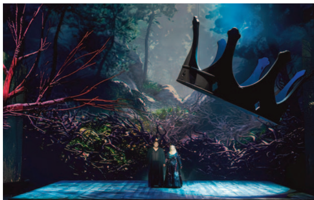
Cena da montagem de Tristão e Isolda no Teatro de la Maestranza

“TRISTÃO E ISOLDA”, DE RICHARD WAGNER, NO THEATRO MUNICIPAL DE SÃO PAULO