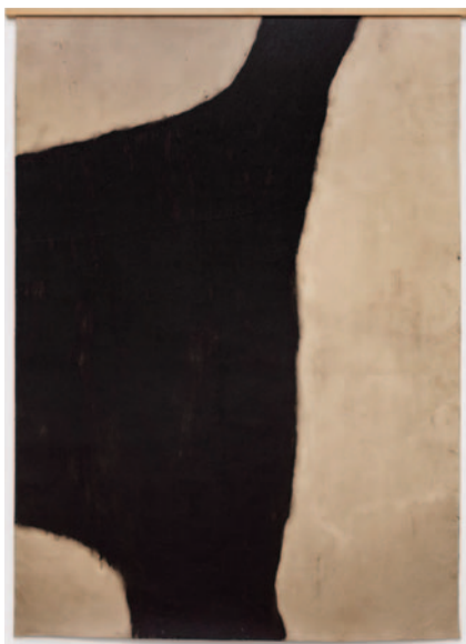
Sem título, 1996

Até 21 de agosto / Galeria Leme / Av. Valdemar Ferreira, 130, Butantã, São Paulo, SP / Segunda a sexta, das 9h às 18h