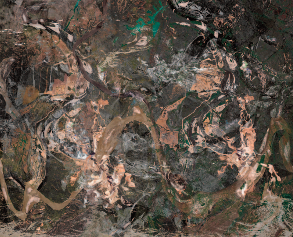
The Collapsing of a Model (O colapso de um modelo) , 2019