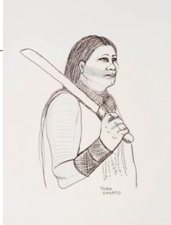
Tuíra Kayapó, My Brazilian Feminine Lineage of Struggle , da série Genealogy of Struggle , 2018-19