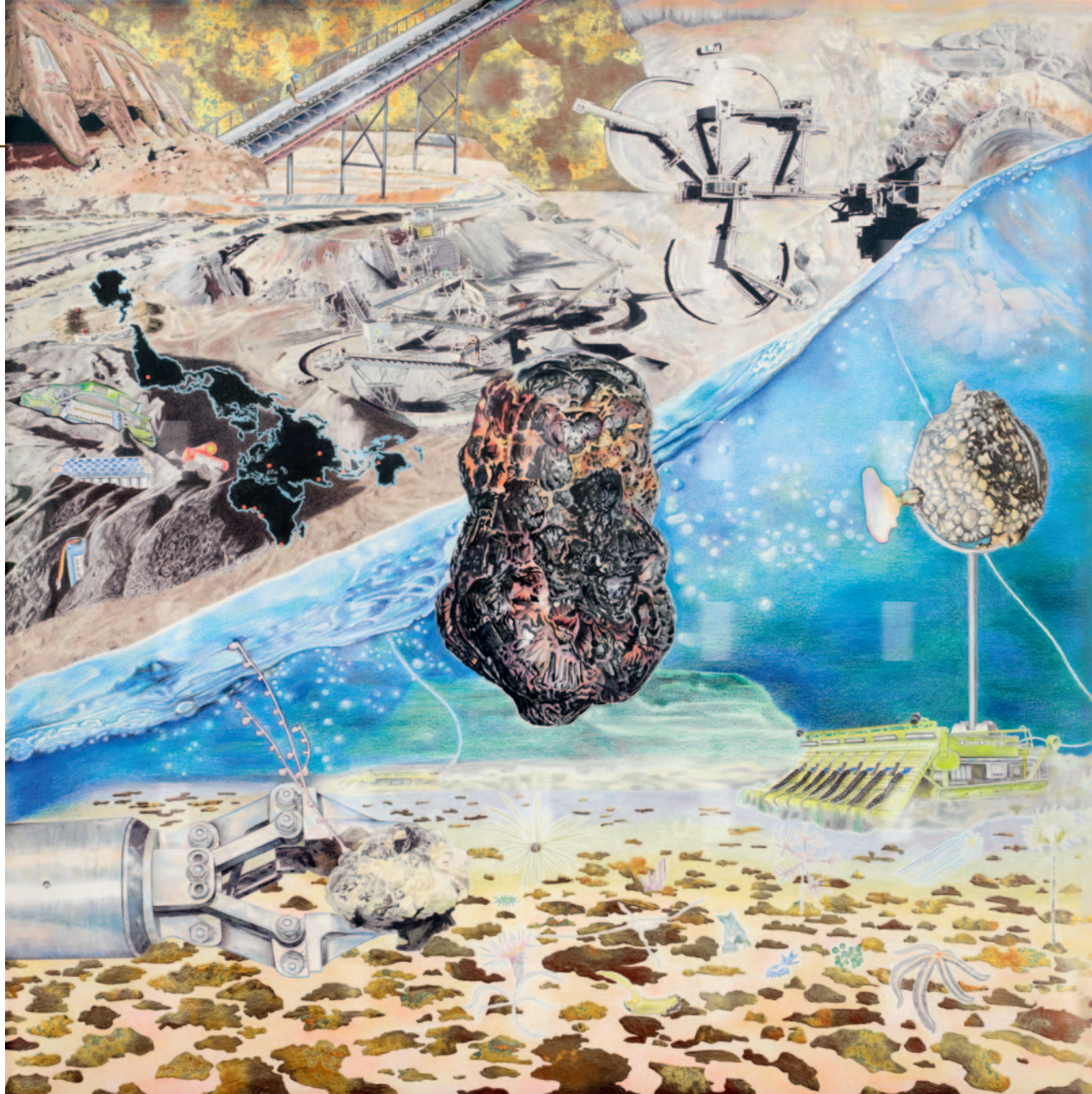
Manganese Intensive (Intensivo em manganês), da série Mineral Intensive (Intensivo em minerais), 2025