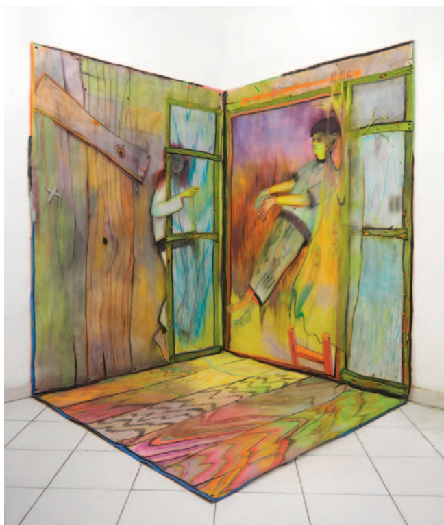
Giuliana Rosso, Tree House , 2023