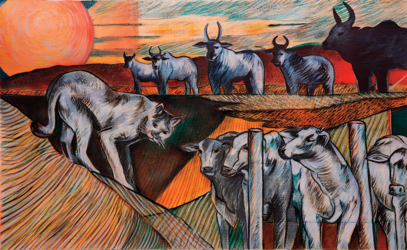
Giulia Mangoni, A onça e as meninas I , 2026