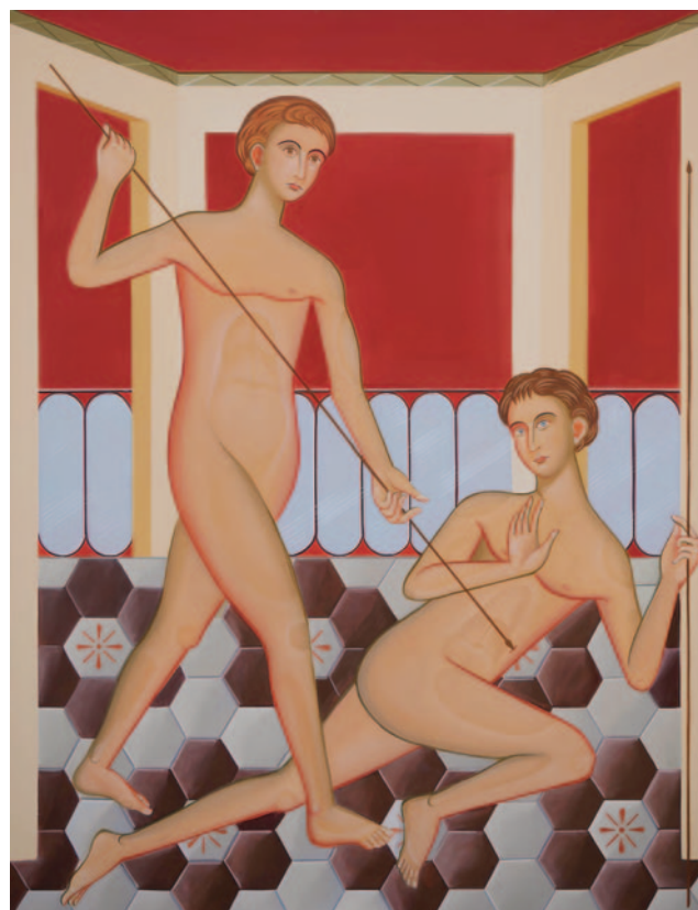
Ismaele Nones, Senza offesa , 2025

SEÇÃO 4: IN BETWEEN – Além de rígidos rótulos e taxonomias, os limites entre figuração e abstração são hoje fluidos, porosos e quase impossíveis de distinguir. Disso derivam composições percebidas como ambíguas – nas quais a figuração passa a se definir por meio da abstração: desmaterializa-se e se liquefaz. Ou se manifesta