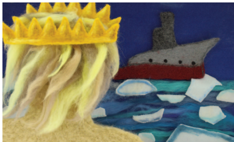
Suur Toll, still

*No domingo de 12 de maio, a Oficina Claquete, excepcionalmente, irá convidar as mães para participarem das Oficinas com seus filhos.