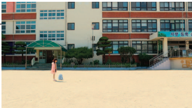
O pátio da escola, still

promisso com a diversidade e a representatividade cultural, ao todo, o FIPC apresenta cerca de 80 títulos, vindos de diversos países, como Bélgica, Cabo Verde, Coréia, Espanha, Estônia, Grécia, Itália, Portugal, Argentina, Índia, Polônia, Canadá, Ucrânia, e de diversas partes do país, como Rio Grande do Sul, Espírito Santo, Bahia, São Paulo, Distrito Federal e Rio de Janeiro, que tratam sobre os principais temas da infância e da juventude sob a perspectiva de quem as está vivenciando.