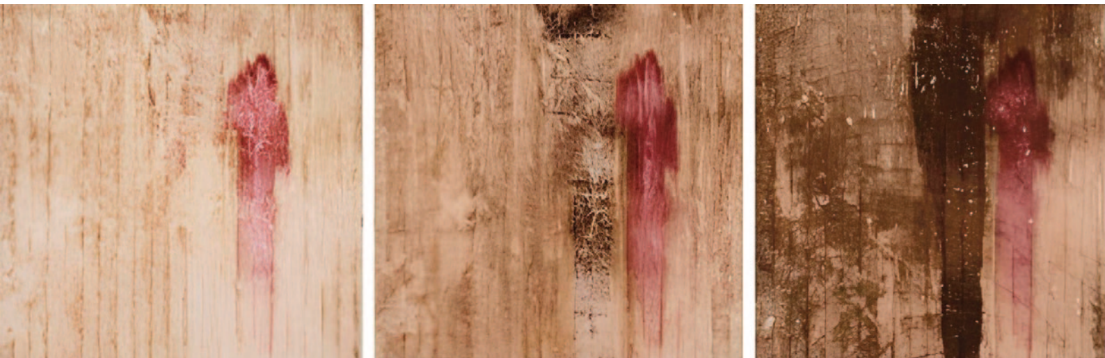
Misty Peach Vision Petal , 2004

Outro ponto alto da exposição é “ Arranjo em cinza e prata ” (2019), apresentada na Sala Academia dos Seletos. A obra foi construída a partir dos carpetes queimados durante o incêndio que atingiu o Teatro Villa-Lobos, em Copacabana, em 2011. Convidado originalmente para produzir um painel para o teatro antes da tragédia, Senise recolheu fragmentos do revestimento carbonizado e, anos mais tarde, incorporou esse material a uma superfície de alumínio altamente reflexiva. O resultado estabelece um diálogo entre destruição,