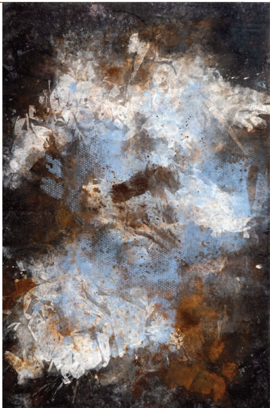
Sem título, 2025

Mais do que uma retrospectiva, “Os dois lados da janela” apresenta um artista em constante transformação. Ao reunir pinturas, monotípias, aquarelas, fotografias e objetos produzidos ao longo dos últimos 25 anos, a exposição evidencia a coerência de uma investigação estética que faz da memória, da arquitetura e dos vestígios do tempo matéria viva para pensar a imagem contemporânea.