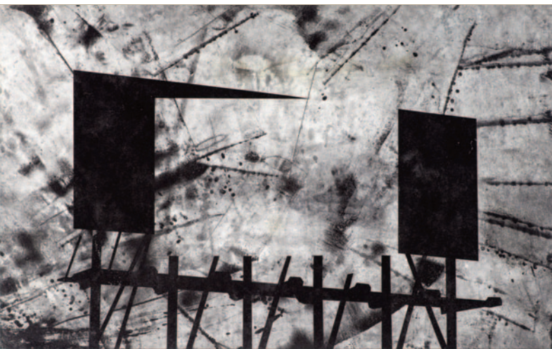
Biógrafo XLI , 2018