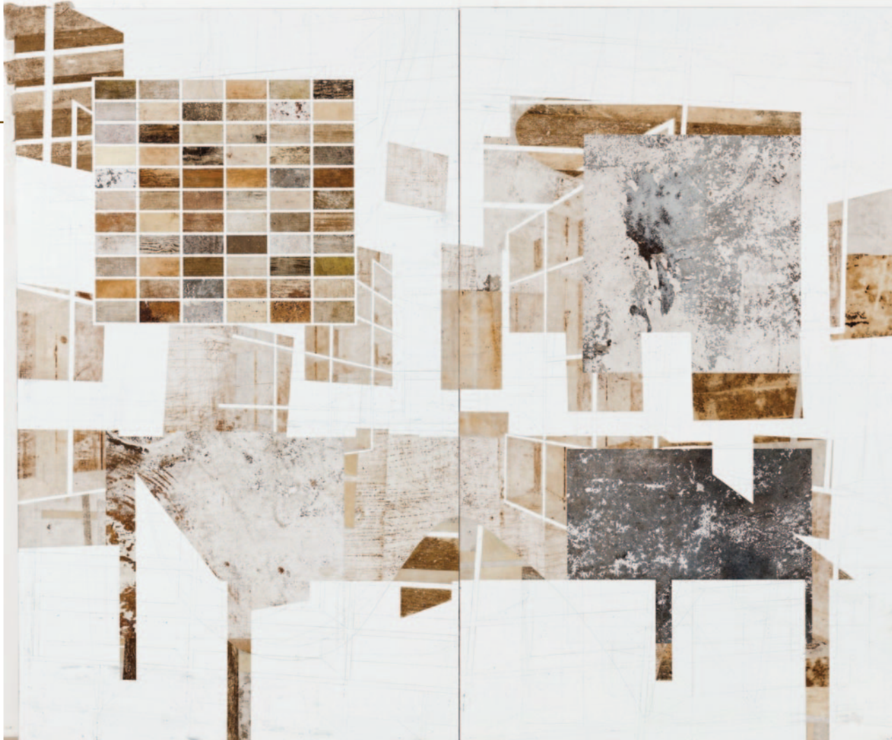
A floresta do livre arbítrio, 2016