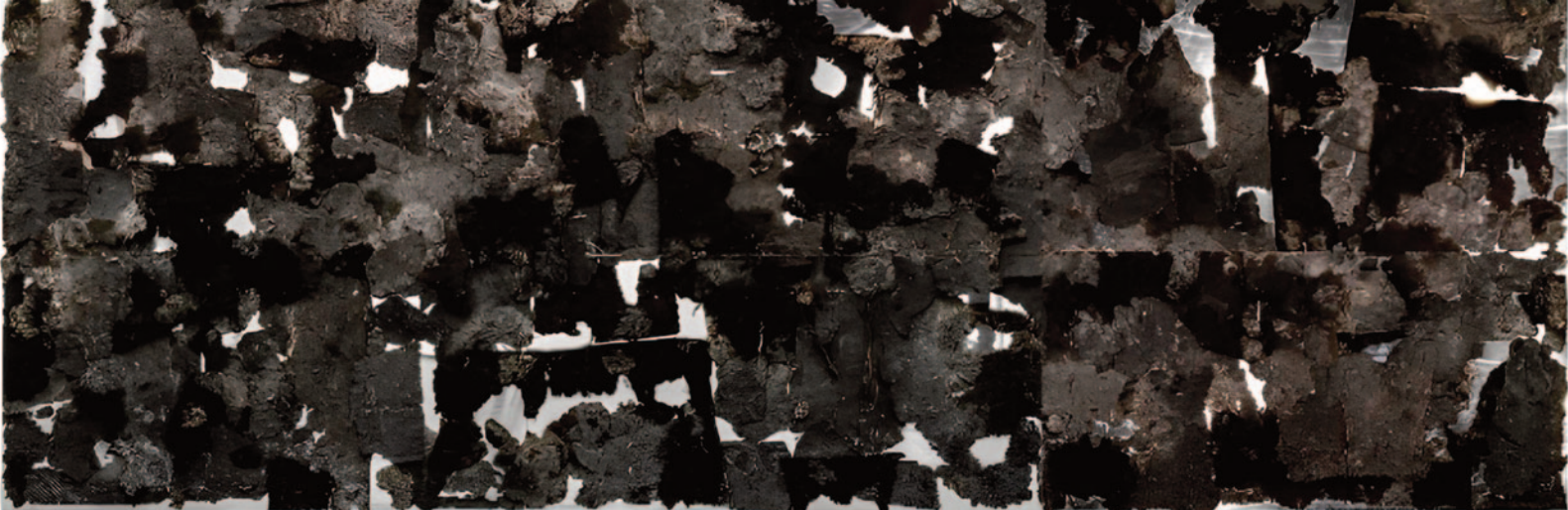
Arranjo em cinza e prata, 2019