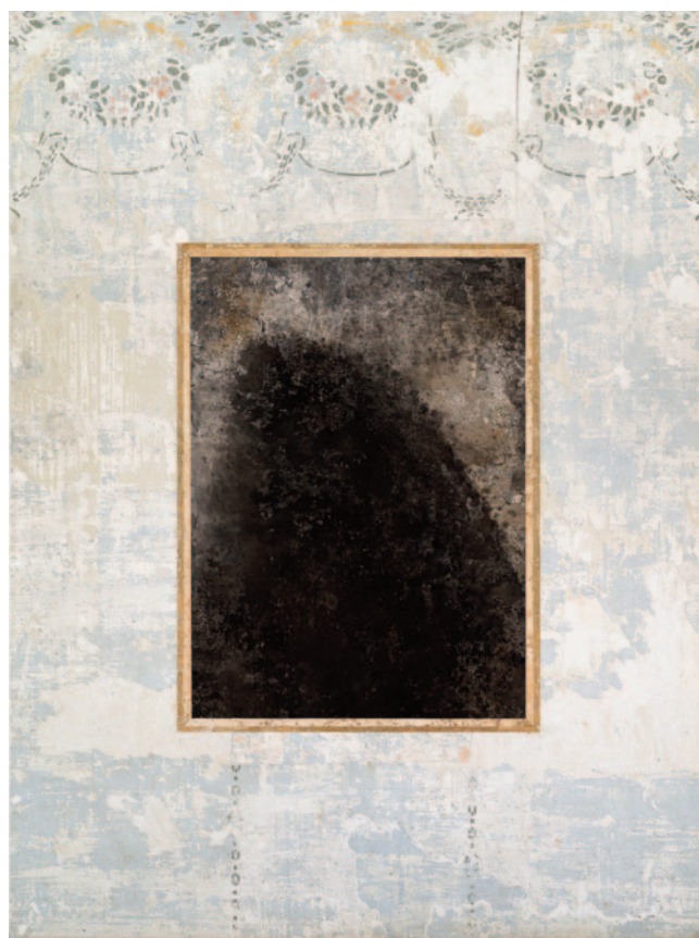
Sem título 01, 2024

apresenta, no Paço Imperial, uma produção que vai muito além dessa investigação. A mostra inclui pinturas, aquarelas, fotografias e objetos que ampliam o entendimento de sua prática artística e revelam um processo criativo marcado pela constante reinvenção.