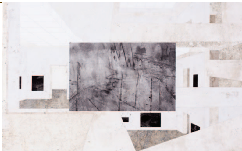
Biógrafo XLVII , 2018

Na Sala Amarela, duas obras da série “ Exs ” demonstram outra faceta da pesquisa do artista. Criadas a partir de capas de livros de arte, reorganizadas em composições modulares, elas evocam elementos da ar-