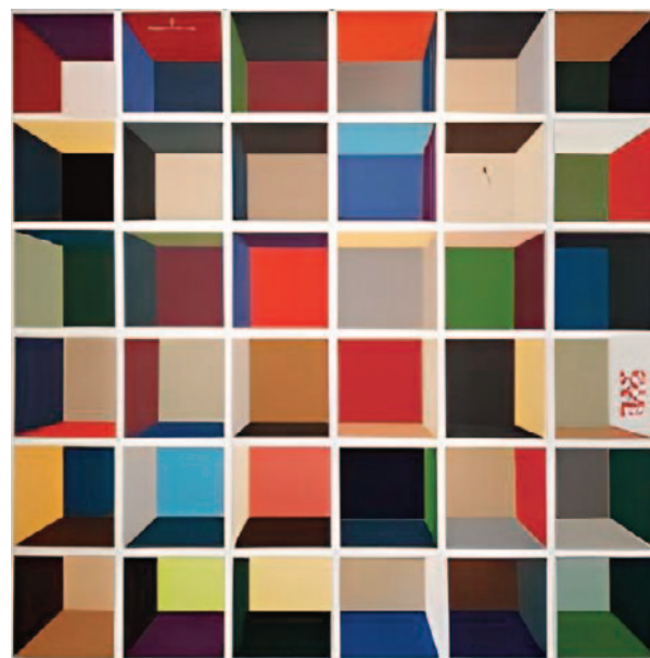
Sem título , da série Exs , 2018

quitetura modernista, especialmente os brise-soleils difundidos por Le Corbusier e amplamente incorporados ao cenário urbano brasileiro. A repetição geométrica transforma páginas impressas em estruturas semelhantes a fachadas, que aproximam pintura, arquitetura e objeto editorial – e ressignificam a ideia clássica da janela como abertura para o mundo.