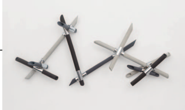
Obra da série Desajustados , 2026

Imprevistos apresenta conjuntos de trabalhos que dialogam entre si. Na nova série “Desajustados” , tubos de cerâmica, com cores variadas e interligados pelo aço inox, trazem a sensação de movimento e de ritmo. Estes trabalhos dialogam diretamente com os da série “Entroncados” , que também são feitos de cerâmica e metal. – Se nos “Desajustados” a cerâmica se expande através de um núcleo de metal, nos “Entroncados” é a fita de aço inox que se expande, a partir do núcleo de cerâmica. – “Um é um pouco o inverso do outro. Um é reto, o outro é curvo. Eles são meio complementares” – ressalta a artista.