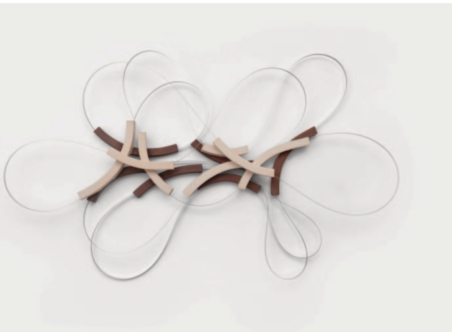
Obra da série Grades , 2026