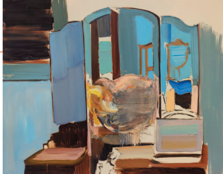
Daniel Lannes, Só os intrascendentes enxergam o óbvio , 2024

Concebida como uma celebração coletiva, a mostra apresenta obras em múltiplas linguagens – pintura, escultura, fotografia, instalação e trabalhos sobre papel – refletindo a diversidade de práticas e investigações que atravessam esses 15 anos de atuação. Mais do que um marco cronológico, a exposição destaca a dimensão relacional que define a história da galeria: um percurso