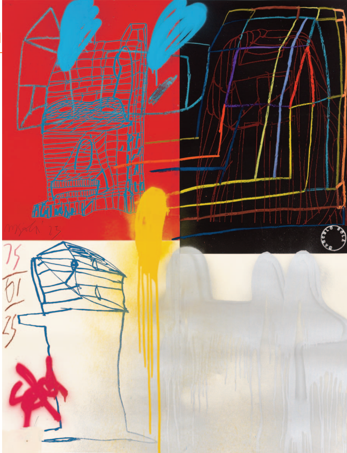
Marcelo Solá, Sem título , 2025