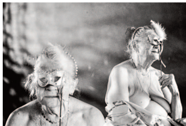
Silvio Bitencourt, Carne Ancestral , 2025