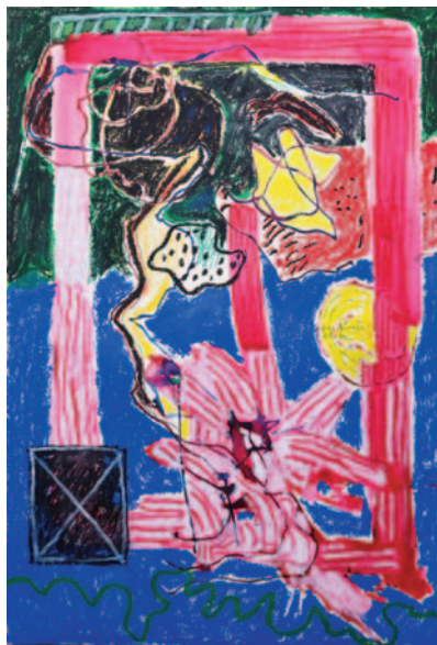
Com oil stick na estrada, 2025-2026