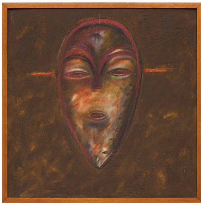
Quem é você – The Mask , 1998

com curadoria de Maria Alice Milliet, reúne pinturas do fim dos anos 1990 em diálogo com máscaras africanas de coleções particulares. A mostra revisita a trajetória de Granato, destacando sua atuação como pintor, desenhista e profundo conhecedor da história da arte, para além da forte presença performática. Em 1998, Granato realiza uma série de pinturas sobre papel chamada The Mask . Na sequência, desenvolve obras de maior fôlego reunidas sob o título Quem é você – The Mask , marcando uma inflexão em sua produção. As obras refletem um movimento de aproximação com memória, ancestralidade e identidade cultural. A curadoria propõe uma leitura que relaciona essas máscaras à busca de raízes e pertencimento, destacando a influência da ancestralidade africana como elemento estruturante na obra de Granato.