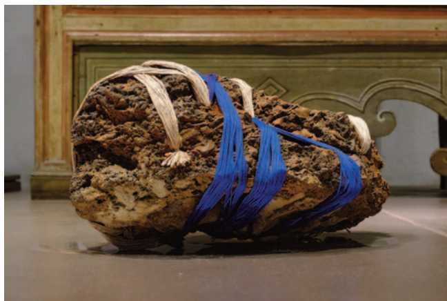
Pedra bordada, 2020/2024