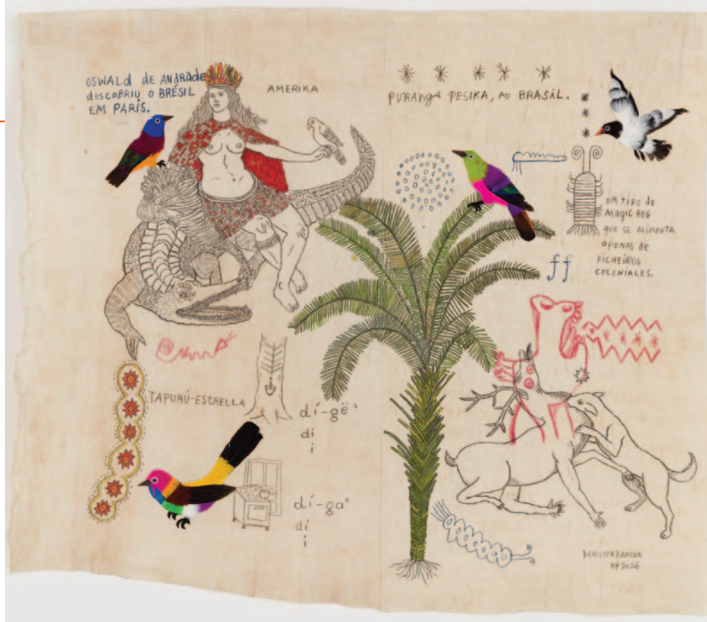
Poema a Oswald de Andrade, 2026