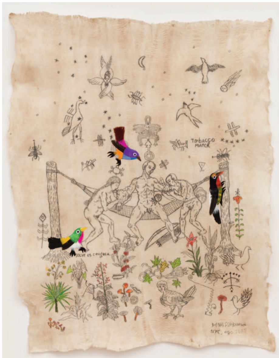
Solve et Coagula (Dissolver e Coagular), 2025

As obras revisitam o passado por meio da reinterpretação de imagens oriundas de tradições e representações locais, bem como de instituições europeias e norte-americanas – incluindo o Musée du Quai Branly , na França; o Museu Nacional de Etnologia de Lisboa, Portugal; a Biblioteca da Universidade de Princeton e a Fundação Getty, ambas nos Estados Unidos –, além de arquivos fotográficos de internatos católicos e missões salesianas em aldeias amazônicas.