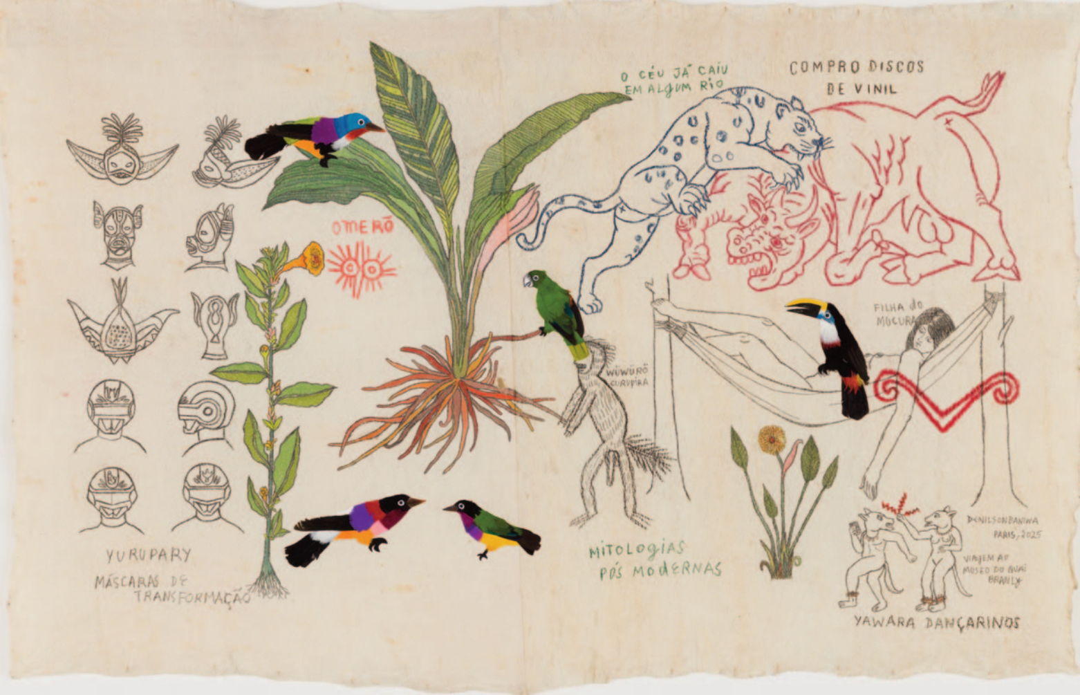
Máscaras de Jurupary, 2025