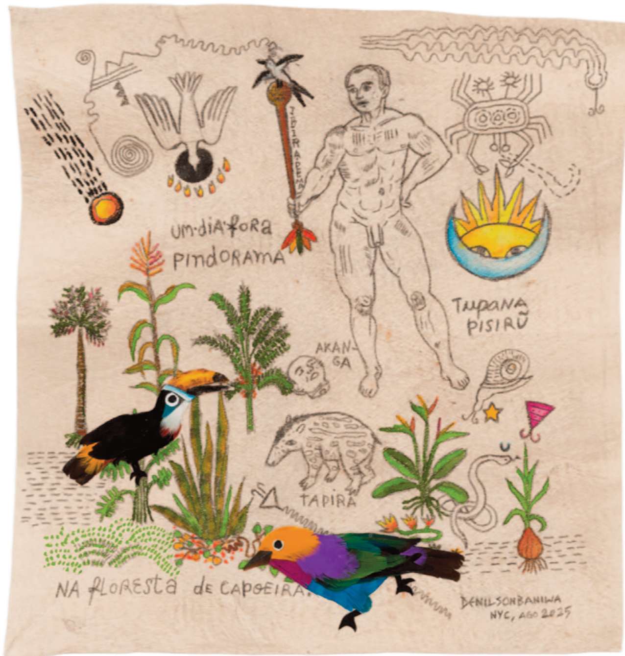
Tupana pisirú (Salvo por Deus), 2025