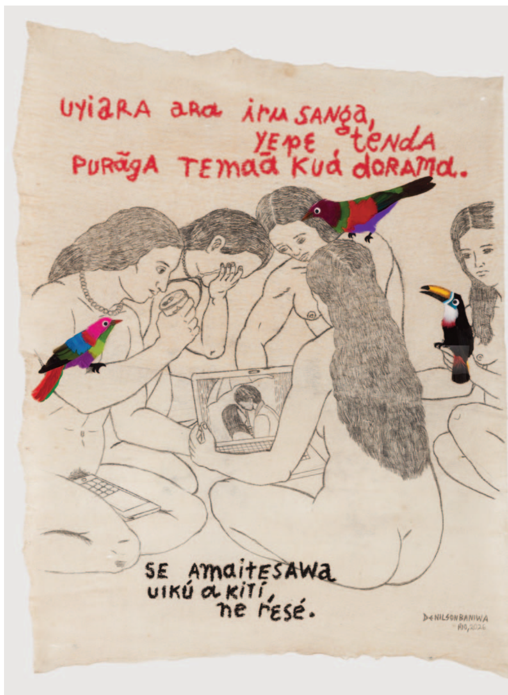
K-Drama (Dorama) , 2026

Meu objetivo é contribuir para a compreensão da história do Brasil a partir de uma perspectiva indígena. Nesse processo, realizo rasuras em ícones históricos, subtraio discursos anti-indígenas e intervenho em imagens racistas, ao mesmo tempo em que evidencio a presença indígena ao longo da história das Américas.