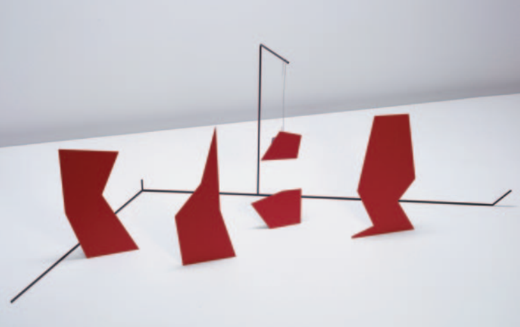
Sem título, 2018