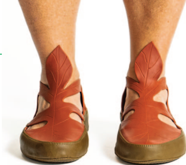
Dr da Borracha, par de sapato folha