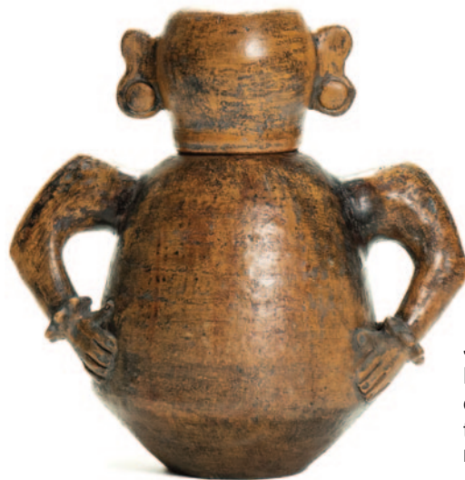
Jefferson, Moringa de cerâmica tapajônica

Além da mostra, que contará com fotografias, audiovisual e objetos, a programação do festival também inclui um seminário com atores e pensadores da Amazônia, entre artesãos, pesquisadores e ativistas, que irão promover reflexões e discussões sobre o contexto da salvaguarda dos saberes populares, as políticas públicas, o mercado de consumo desse artesanato, processos de cocriação e iniciativas que são referência de desenvolvimento sustentável.