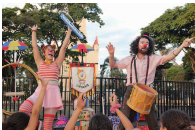
Em Busca de?

Uma dupla de palhaços chega ao Brasil para realizar seus sonhos e entender como vivem os artistas de rua.