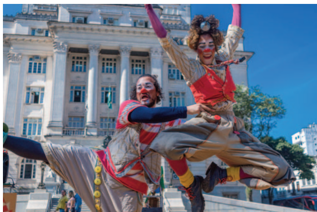
A Trombeta Apocalíptica