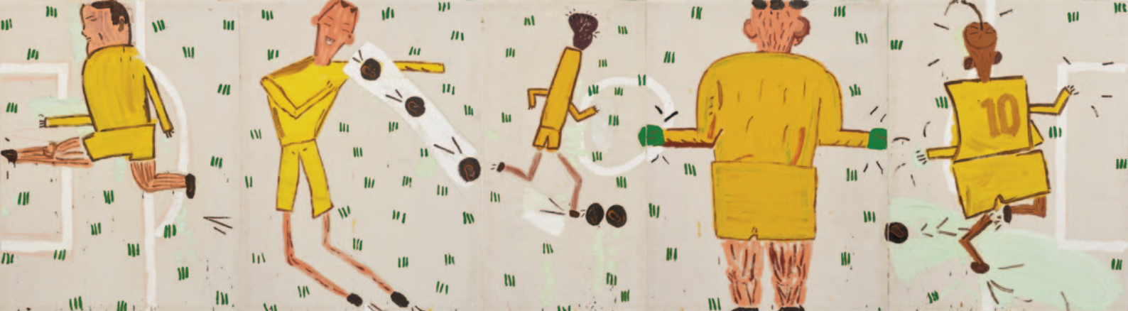
Yellow Strip, 2006