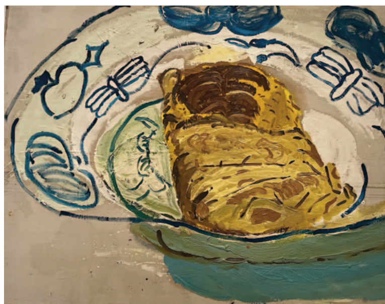
The Well-Cooked Omelette , 1989

não ser precisa e, se tenho uma lembrança afetiva de algo, o trabalho que faço me dá a chance de relacionar a obra à memória.” Por isso a repetição é parte estrutural de seu método: uma mesma imagem pode ser refeita em várias telas, com fundos diferentes, detalhes alterados, como se o ato de pintar fosse também um ato de lembrar outra vez.