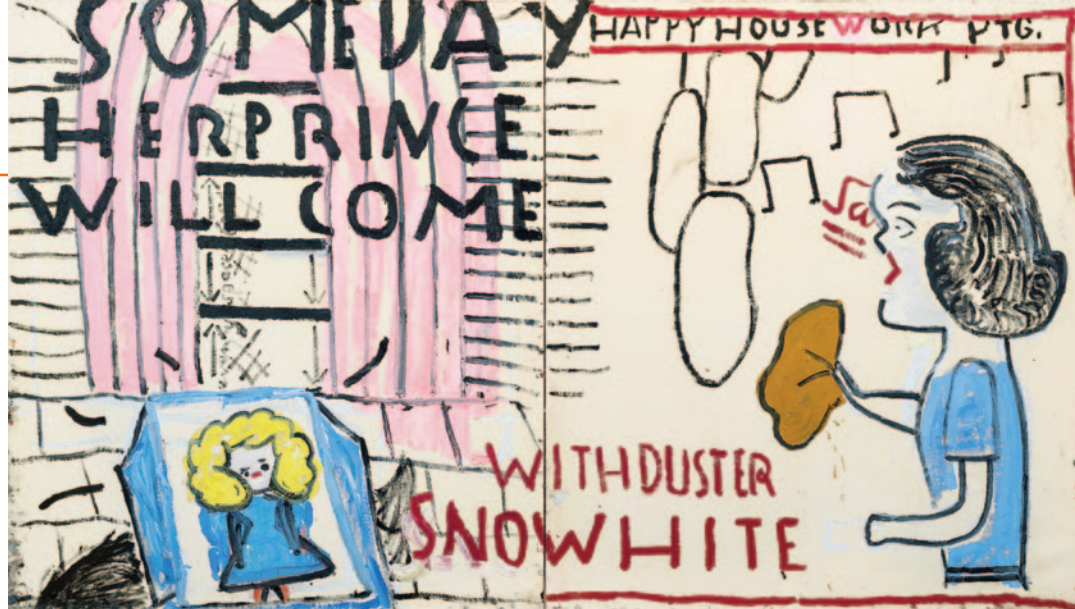
Snowwhite (3) with Duster, 2018