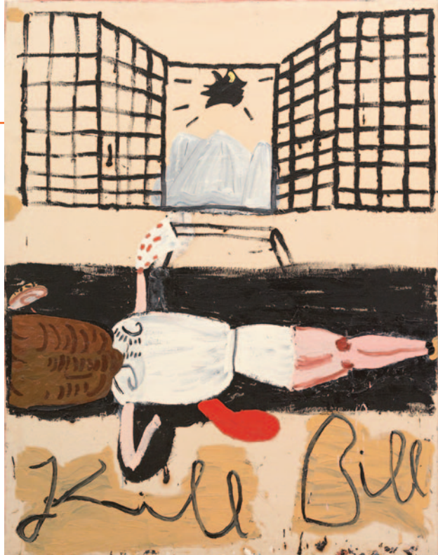
Kill Bill (Film Notes), 2007