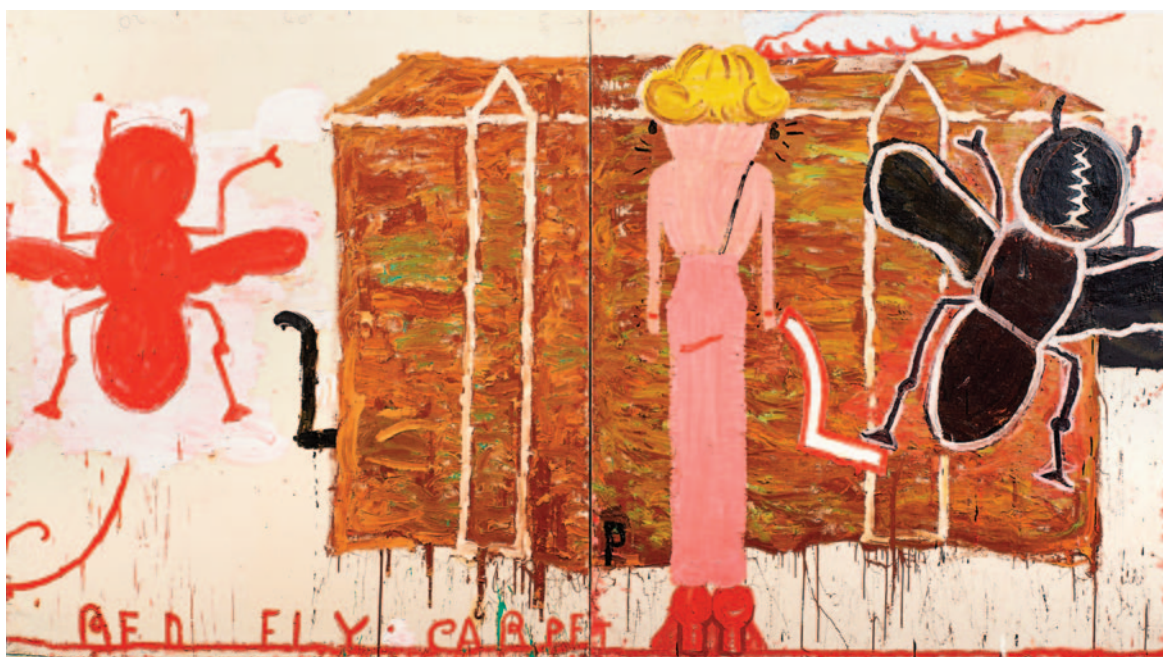
Black Strap (Red Fly), 2012

https://www.royalacademy.org.uk/exhibition/rose-wylie