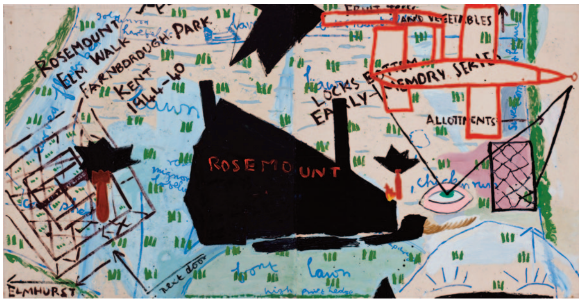
Rosemount (Coloured), 1999

Courtesy Vladimir Ovcharenko © Rose Wylie