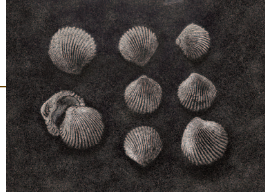
Vik Muniz, Fósseis de Conchas Marinhas da Bacia de Paris, 45 Milhões de Anos , série Museu das Cinzas , 2019

ao estudo do movimento: “ Objeto cinético P-28 ” (1971/2000) e “ Objeto cinético KK-9ª ” (1966/2009).