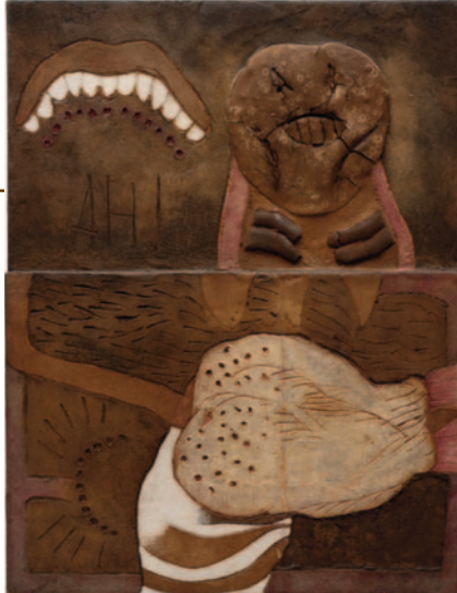
Antonio Dias, AH! , 1964