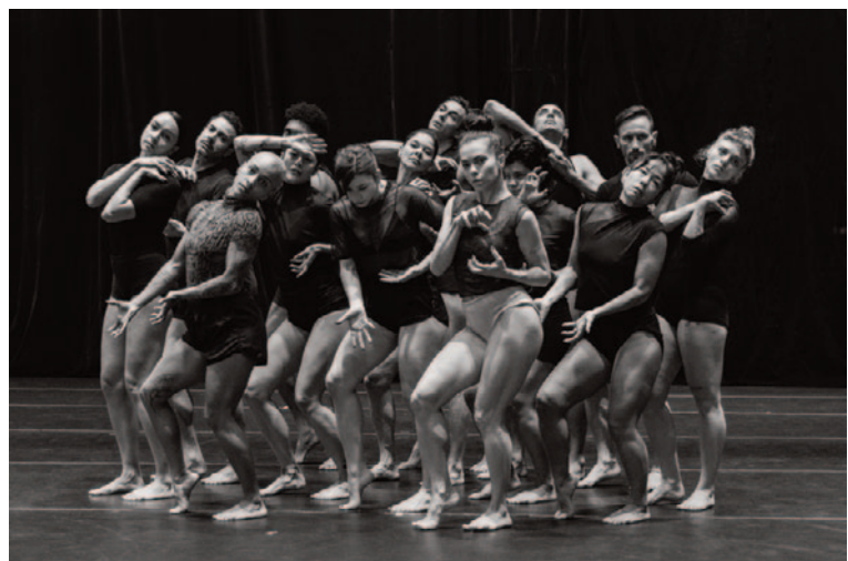
até que se abra tudo