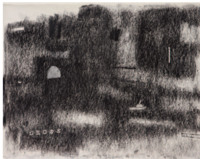
Obra de Ana Takenaka

NICHOLAS STEINMETZ (1996, Curitiba, PR; vive e trabalha em São Paulo) constrói uma produção que atravessa narrativa, espacialidade e anacronismo na formação