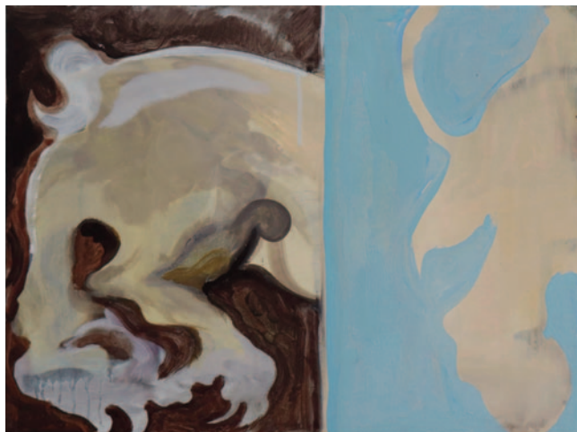
Obras de Nicholas Steinmetz