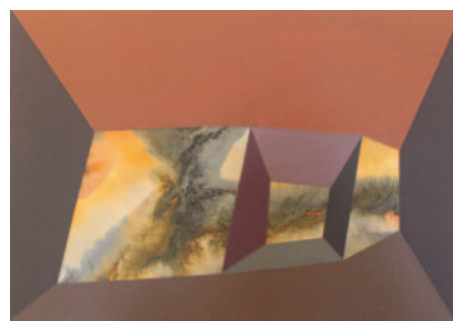
Miguel Nader