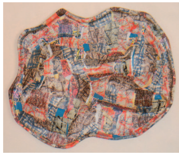
Cosme Martins