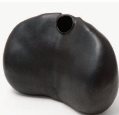
Enigma Bottle – Nike , 2009

© Estate of Donald Locke; Foto: Michael Brzezinski