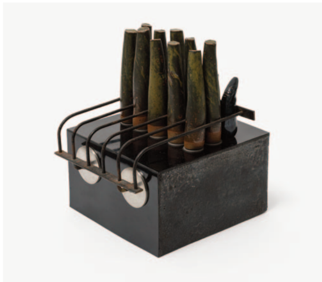
Plantation Series X/1, 1973 © Estate of Donald Locke; Foto: Michael Brzezinsk

E aí tem Trophies of Empire (1972-1974), que é a obra que pára todo mundo na sala. Uma estante de madeira com 27 compartimentos, cada um com um cilindro cerâmico preto – que Locke chamava de “bala” – e que, claramente, também funciona como forma fállica. Dois deles aparecem amarrados com correias de couro velho. Fiquei parada na frente dessa peça por um bom