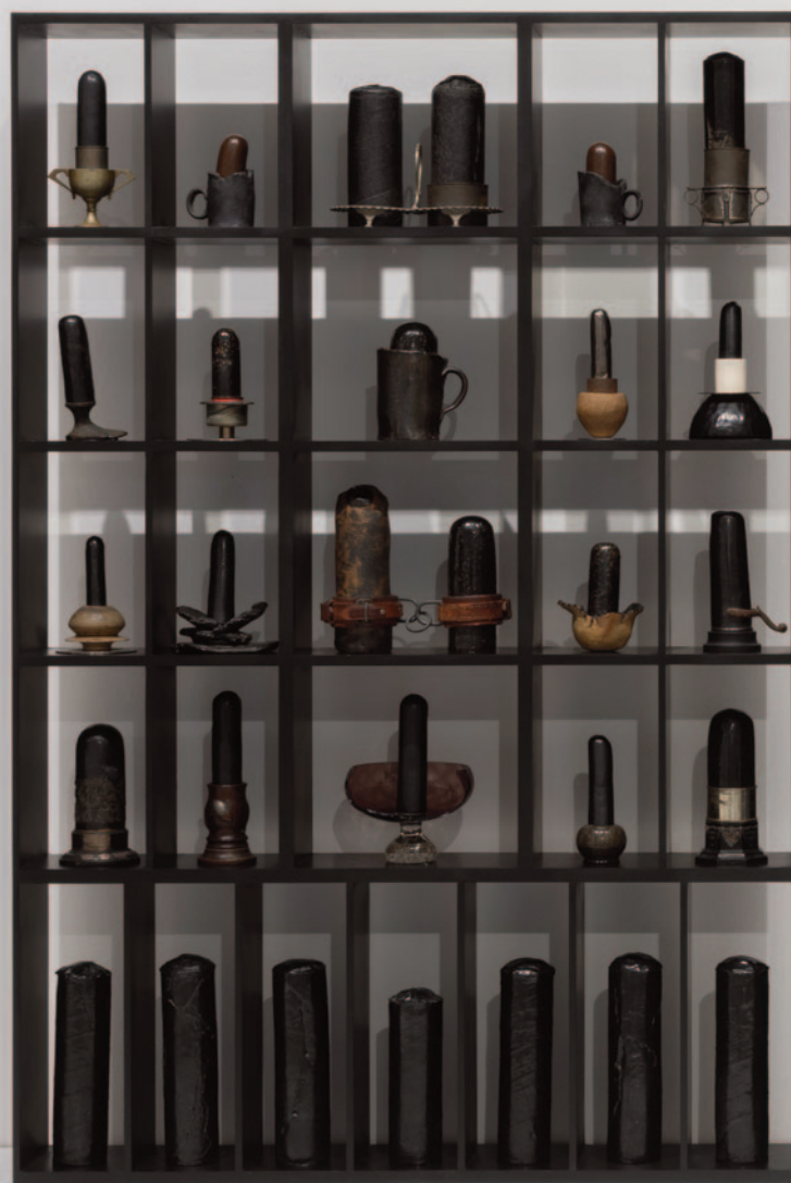
Trophies of Empire , 1972-1974